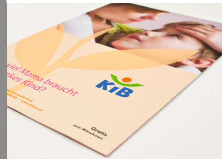
KIB children care