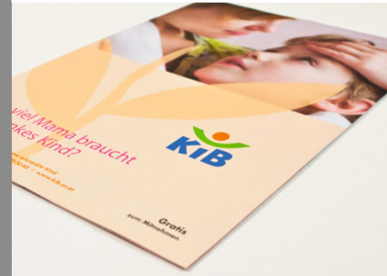
KIB children care