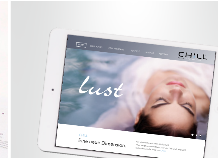
CHILL Pool + Spa

Komplexes wird einfach. Wie in der Musik ergeben Priorität, Rhythmus und Klarheit im Ausdruck den schönsten Klang.